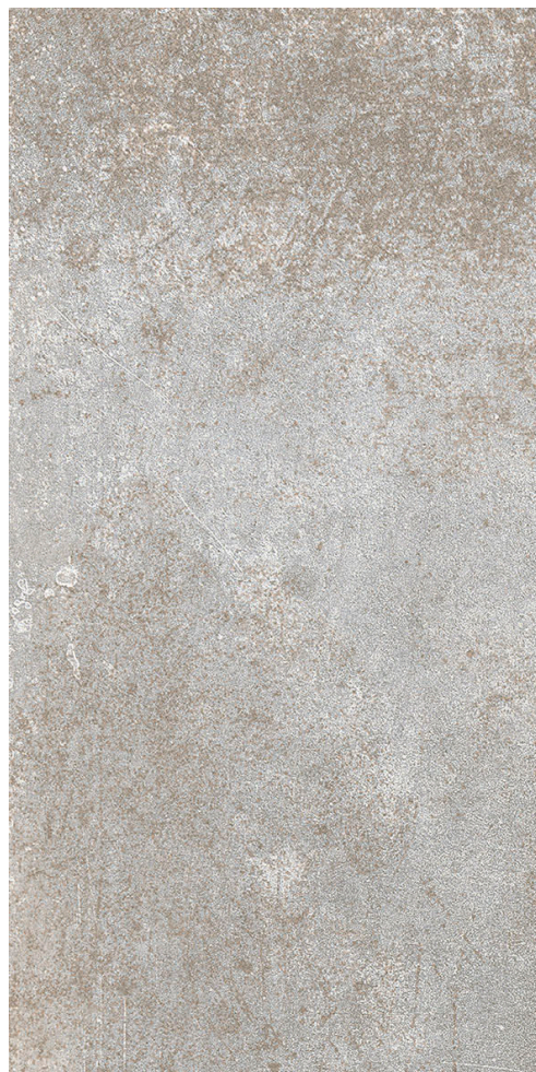
30 x 60 cm (12 x 24) RD.RM.STL.1224

Tous les items présentés dans ce document font partie du programme d'inventaire Olympia. Pour les commandes spéciales, veuillez contacter votre représentant de Tuiles Olympia.