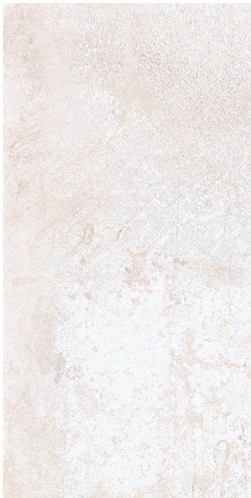
30 x 60 cm (12 x 24) RD.RM.DST.1224