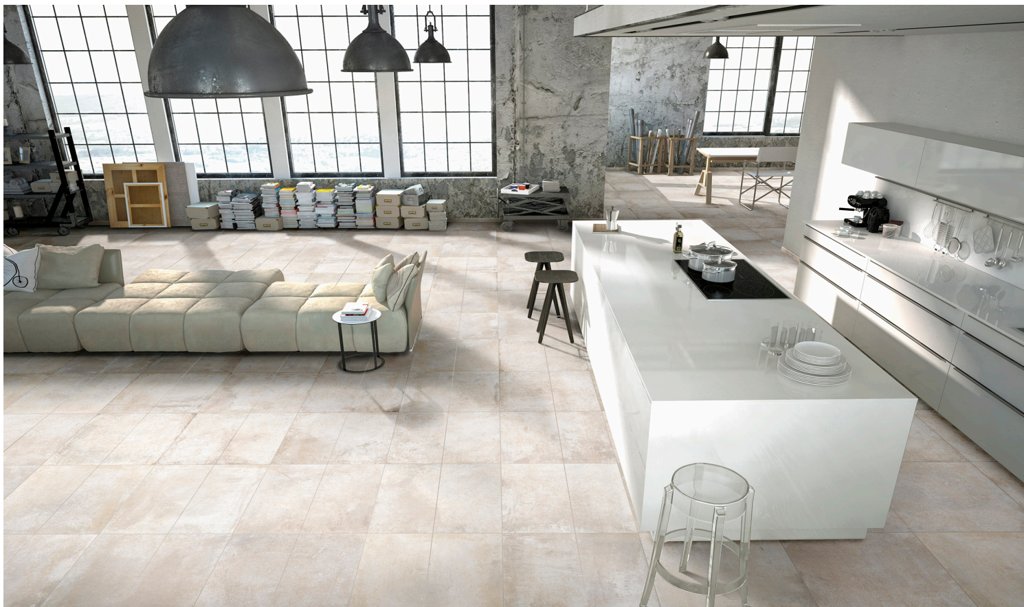
DUST (Blanc Cassé)